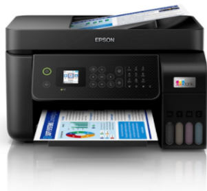
機型: C11CJ55509 | 產品專頁